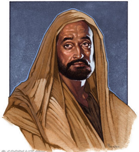
Paul Defends His Apostleship

Միթէ սխա՛լ գործած եղայ ես զիս խոնարհեցնելով՝ որպէսզի դո՛ւք բարձրանաք, քանի որ ձրի քարոզեցի ձեզի Աստուծոյ աւետարանը. կողոպտեցի ուրիշ եկեղեցիներ՝ թոշակ առնելով անոնցմէ, որպէսզի սպասարկեմ ձեզի: Ձեր մէջ ներկայ եղած ատենս՝ երբ կարօտութեան մէջ էի, ձեզմէ ո՛չ մէկուն բռն եղայ. որովհետև Մակեդոնիայէն եկող եղբայրները լրացուցին ինչ որ կը պակսեր ինծի. եւ ամէն կերպով զգուշացայ ձեզի ծանրութիւն ըլլալէ, ու դարձեալ պիտի զգուշանամ: Զանի որ Քրիստոսի ճշմարտութիւնը իմ մէջս է, ո՛չ մէկը պիտի արգիլէ զիս այս պարծանքէն՝ Աքայիայի շրջանները: