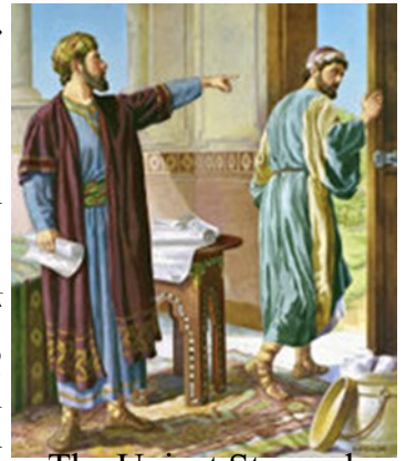
The Unjust Steward

“Հարիւր քոռ ցորեն”: Ըսաւ անոր. “Ա՛ն մուրհակդ եւ «ութսո՛ւն» գրէ”: Տէրը զովեց անիրաւ տնտեսը՝ որ ուշիմութեամբ վարուեցաւ. որովհետեւ այս աշխարհի որդիները աւելի՛ ուշիմ են իրենց սերունդին մէջ՝ քան լոյսի որդիները: Ես ալ կ’ըսեմ ձեզի. “Բարեկամներ՝ ըրէք ձեզի անիրաւ մամոնայէն, որպէսզի երբ ան պակսի”, ընդունին ձեզ յաւիտենական բնակարաններու մէջ”: Ա՛ն որ ամենափոքր բանին մէջ հաւատարիմ է՝ շատին մէջ ալ հաւատարիմ կ’ըլլայ, եւ ա՛ն որ ամենափոքրին մէջ անիրաւ է՝ շատին մէջ ալ անիրաւ կ’ըլլայ: Ուրեմն եթէ անիրաւ մամոնային մէջ հաւատարիմ չըլլաք, ճշմարիտ հարստութիւնը ո՛վ պիտի վստահի ձեզի: Եթէ ուրիշին բանին մէջ հաւատարիմ չըլլաք, ձեր ո՛վ պիտի տայ ձեզի: Ո՛չ մէկ ծառայ կրնայ ծառայել երկու տիրոջ. որովհետեւ կա՛մ մէկը պիտիատէ եւ միւսը սիրէ, կա՛մ մէկուն պիտի յարի՝ ու միւսը արհամարհէ: Չէք կրնար ծառայել Աստուծոյ եւ մամոնային»: