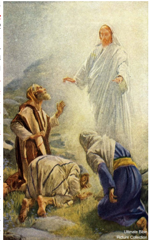
Ultimate Bible Picture Collection

Երբ լեռնէն վար կ'իջնէին, Յիսուս հրահանգեց անոնց. «Այդ տեսիլքը ո՛չ մէկուն պատմեցեք, մինչեւ որ մարդու Որդին մեռելներէն յարութիւն առնէ»: Աշակերտները հարցուցին իրեն. «Հապա ինչո՞ւ դպիրները կ'ըսեն թէ “պետք է որ նախ Եղիա գայ”»: Յիսուս պատասխանեց անոնց. «Իրաւ է թէ նախ Եղիա պիտի գայ եւ վերահաստատէ ամէն բան: Բայց ձեզի կ'ըսեմ թէ Եղիա արդէն եկած է, ու չճանչցան զայն, հապա ինչ որ ուզեցին՝ ըրին անոր. նոյնպէս ալ մարդու Որդին պիտի չարչարուի անոնցմէ»: Այն ատեն աշակերտները հասկցան թէ Յովհաննէս Մկրտիչին մասին ըսաւ իրենց: