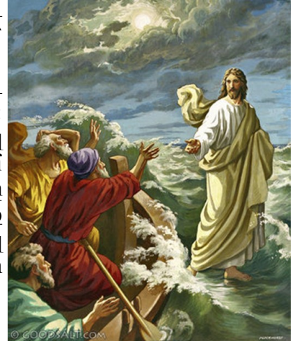
Christ Walking on the Water

Երբ իրիկուն եղաւ՝ իր աշակերտները իջան ծովեզերքը, ու նաւ մտնելով կ'երթային ծովուն միւս կողմը՝ Կափառնայում: Արդէն մթնցած էր, բայց դեռ Յիսուս եկած չէր իրենց: Ծովն ալ պէկոծ էր՝ սաստիկ փչող հովէն: Երբ թի վարելով քսանհինգ կամ երեսուն ասպարեզի չափ գացին՝ տեսան Յիսուսը, որ կը մօտենար նաւուն՝ ծովուն վրայ քալելով, ու վախցան: Բայց ինք ըսաւ անոնց. «Ե՛ս եմ, մի՛ վախնաք»: Ուստի ուզեցին ընդունիլ զինք նաւուն մէջ. եւ նաւը իսկոյն հասաւ այն երկիրը՝ ուր կ'երթային: