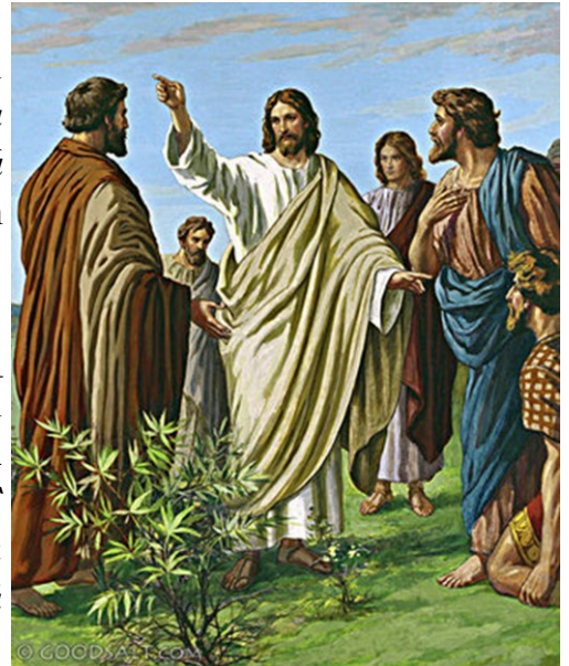
Mission of the Twelve

Յիսուս ըսաւ անոր. « Մի՛ արգիլէք, որովհետեւ ան որ մեզի հակառակ չէ, մեր՝ կողմէն է »: