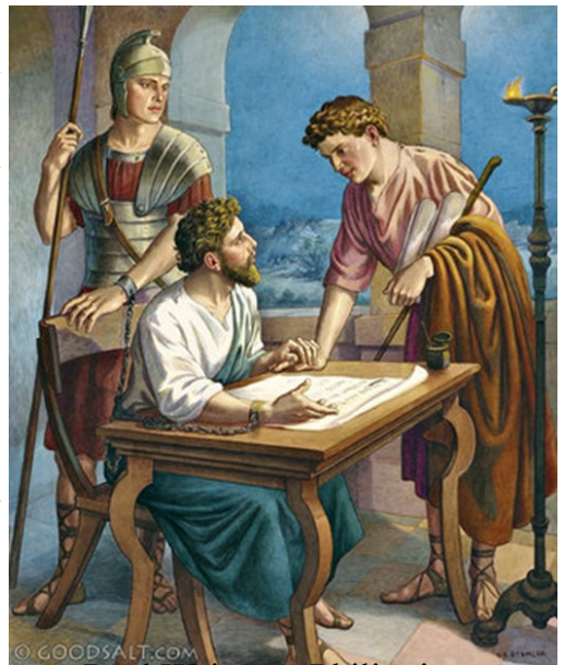
Paul Writes to Philippians

Շնորհակալ կ'ըլլամ իմ Աստուծոյ՝ ձեզմէ ունեցած բոլոր յիշատակներու համար, ամէն ատեն՝ ամէն աղերսանքիս մէջ: Ուրախութեամբ կ'աղերսեմ ձեր բոլորին համար, քանի որ հաղորդակից եղաք աւետարանին՝ առաջին օրէն մինչեւ հիմա. այս մասին համոզուած եմ թէ ան որ սկսաւ բարի գործ մը ձեր մէջ, պիտի աւարտէ մինչեւ Յիսուս Քրիստոսի օրը: Իրաւացի ալ է ինծի այսպէս մտածել ձեր բոլորին մասին, քանի որ ձեզ ունիմ իմ սիրտիս մէջ", ու դուք բոլորդ հաղորդակցեցաք ինծի եղած շնորհքին՝ թէ՛ իմ կապերու, թէ՛ ալ աւետարանին ջատագովութեան եւ հաստատութեան մէջ: Որովհետեւ