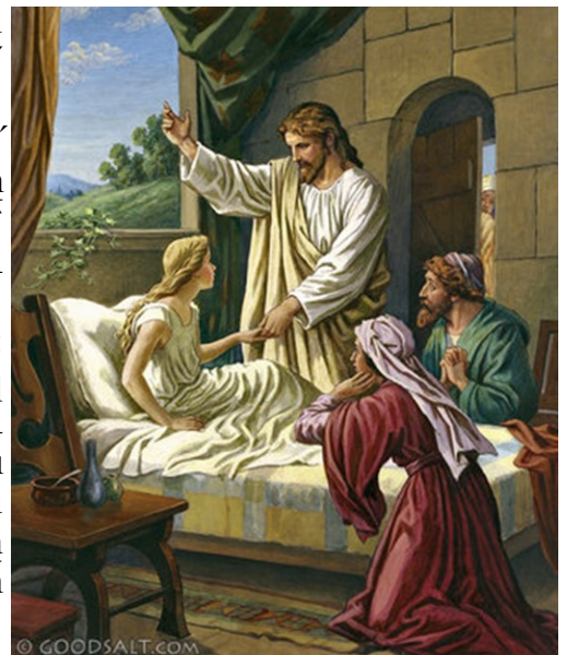
Jairus' Daughter Restored to Life

Բայց երբ Յիսուս լսեց ասիկա՝ ըսաւ անոր. «Մի՛ վախճանար, միայն հաւատաւ, ու պիտի ապրի»: Երբ տունը մտաւ, ո՛չ մէկուն թոյլ տուաւ որ մտնէ, բայց միայն՝ Պետրոսի, Յակոբոսի ու Յովհաննէսի, եւ աղջկին հօր ու մօր: Բոլորն ալ կու լային եւ կը հեծե՛նէին անոր վրայ. բայց ինք ըսաւ. «Մի՛ լաք. ան մեռած չէ, հասցաւ կը քնանայ»: Անոնք ալ գինք ծաղրեցին, քանի գիտէին թէ մեռաւ: Իսկ ինք բոլորն ալ դուրս հանելով՝ բռնեց անոր ձեռքէն, ու գոչեց՝ ըսելով. «Աղջի՛կ, ոտքի՛ ելիր»: Անոր հոգին վերադարձաւ, եւ ան անմիջապէս կանգնեցաւ: Յիսուս հրամայեց՝ որ անոր ուտելիք տան: Անոր ծնողները զմայլած մնացին, եւ ինք պատուիրեց անոնց՝ որ պատահածը ո՛չ մէկուն ըսեն: