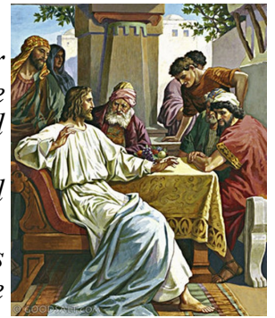
Christ at the Table of Pharisee

“Then the master told his servant, ‘Go out to the roads and country lanes and compel them to come in, so that my house will be full. 24I tell you, not one of those who were invited will get a taste of my banquet.’ ”