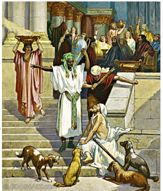
Lazarus and the Rich Man

"There was a rich man who was clothed in purple and fine linen and who feasted sumptuously every day. And at his gate was laid a poor man named Lazarus, covered with sores, who desired to be fed with what fell from the rich man's table. Moreover, even the dogs came and licked his sores. The poor man died and was carried by the angels to Abraham's side. f The rich man also died and was buried, and in Hades, being in torment, he lifted up his eyes and saw Abraham far off and Lazarus at his side. And he called out, 'Father Abraham, have mercy on me, and send Lazarus to dip the end of his finger in water and cool my tongue, for I am in anguish in this flame.' But Abraham said, 'Child, remember that you in your lifetime received your good things, and Lazarus in like manner bad things; but now he is comforted here, and you are in anguish. And besides all this, between us and you a great chasm has been fixed, in order that those who would pass from here to you may not be able, and none may cross from there to us.' And he said, 'Then I beg you, father, to send him to my father's house—for I have five brothers—so