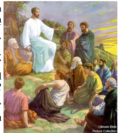
Jesus teaching the twelve

– Կ'ըսեմ ձեզի,– եզրակացուց Յիսուս,– մաքսաւորն է որ արդարացած տուն գնաց, եւ ո՛չ թէ Փարիսեցին. որովհետեւ ով որ իր անձը կը բարձրացնէ՝ պիտի խոնարհի, եւ ով որ իր անձը խոնարհեցնէ՝ պիտի բարձրանայ: