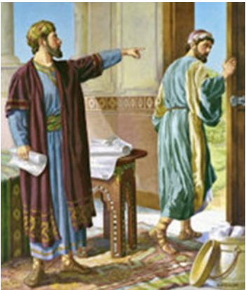
The Unjust Steward

Ան որ ամենափոքր բանին մէջ հաւատարիմ է շատին մէջ ալ հաւատարիմ կ'ըլլայ, եւ ան որ ամենափոքրին մէջ անիրաւ է շատին մէջ ալ անիրաւ կ'ըլլայ: Ուրեմն եթէ անիրաւ մամոնային մէջ հաւատարիմ չըլլաք, ճշմարիտ հարստութիւնը ո՞վ պիտի վստահի ձեզի: Եթէ ուրիշին բանին մէջ հաւատարիմ չըլլաք, ձեր ո՞վ պիտի տայ ձեզի: Ո՛չ մէկ ծառայ կրնայ ծառայել երկու տիրոջ. որովհետեւ կա՛մ մէկը պիտի ստէ եւ միւսը սիրէ, կա՛մ մէկուն պիտի յարի՝ ու միւսը արհամարհէ: Չէք կրնար ծառայել Աստուծոյ եւ մամոնային»: