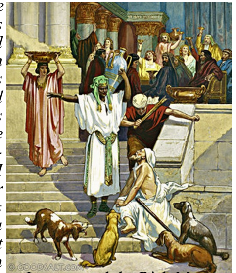
Lazarus and the Rich Man

“There was a rich man who was clothed in purple and fine linen and who feasted sumptuously every day. And at his gate was laid a poor man named Lazarus, covered with sores, who desired to be fed with what fell from the rich man’s table. Moreover, even the dogs came and licked his sores. The poor man died and was carried by the angels to Abraham’s side. 6 The rich man also died and was buried, and in Hades, being in torment, he lifted up his eyes and saw Abraham far off and Lazarus at his side. And he called out, ‘Father Abraham, have mercy on me, and send Lazarus to dip the end of his finger in water and cool my tongue, for I am in anguish in this flame.’ But Abraham said, ‘Child, remember that you in your lifetime received your good things, and Lazarus in like manner bad things; but now he is comforted here, and you are in anguish. And besides all this, between us and you a great chasm has been fixed, in order that those who would pass from here to you may not be able, and none may cross from there to us.’ And he said, ‘Then I beg you, father, to send him to my father’s house for I have five brothers so that he may warn them, lest they also come into this place of torment.’ But Abraham said, ‘They have Moses and the Prophets; let them hear them.’ And he said, ‘No, father Abraham, but if someone goes to them from the dead, they will repent.’ He said to him, ‘If they do not hear Moses and the Prophets, neither will they be convinced if someone should rise from the dead.’”