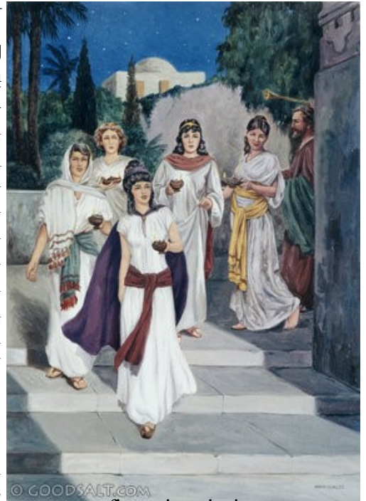
five wise virgins

Հարսնիքի մը ընթացքին տասը կոյսեր, իրենց լապտերները ի ձեռին, մեծ խանդավառութեամբ կը սպասեն փեսային ժամանման, անոր հետ մտնելու հարսնարան եւ ուրախանալու: Տասը կոյսերէն հինգը իմաստուն էին, որոնք իրենց հետ վերցուցած էին յաւելեալ ձէթ՝ իրենց լապտերներուն համար, մինչ միւս հինգը յիմար էին՝ որովհետեւ իրենց հետ չէին առած պահեստի վառելանիւթ: Փեսան կ'ուշանայ, իսկ կոյսերը քունի կ'անցնին: Երբ ուշ ժամերուն կը յայտարարուի թէ ահա փեսան կու գայ, կոյսերը անմիջապէս կը պատրաստուին փեսան դիմաւորելու, սակայն միայն իմաստուն կոյսերը կը կարողանան փեսան դիմաւորել եւ անոր հետ հարսնարան մտնել, որովհետեւ իրենց հետ տարած յաւելեալ վառելանիւթով իրենց լապտերները կը վառեն, մինչ միւս հինգը քաղաք կը շտապեն ձէթ գնելու եւ իրենց լապտերները վառելու: Սակայն արդէն ուշ կ'ըլլայ, իրենց վերադարձին՝ հարսնարանի դուռը փակ կը գտնեն եւ զուր տեղը դուռը կը թողնեն, դուռը բացող չ'ըլլար (Մտ 25.1-13):