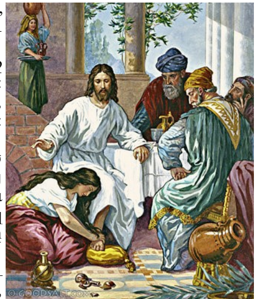
Mary Anoints Jesus' Feet

Այս պատարագը կարելի է երէք տարբեր անուններով կոչել.