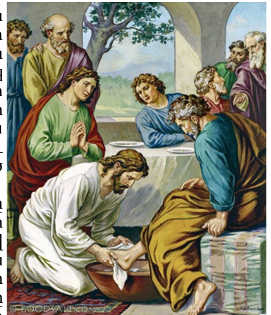
WASHING OF THE FEET

St Yeghiche Armenian Church Parish Council.