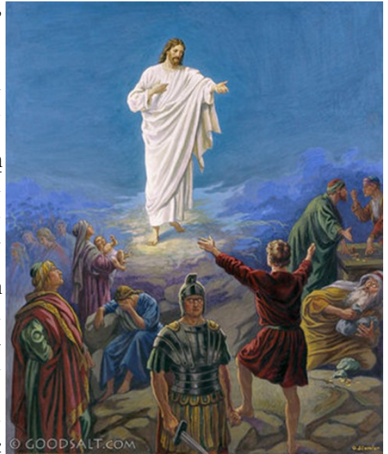
Christ the Light and Life of Men

Եւ Իսօսքը մարմին եղաւ ու մեր մէջ բնակեցաւ, (եւ դիտեցինք անոր փառքը՝ Հօրը միածինի փառքին պէս,) շնորհքով ու նշարտութեամբ լեցուն: Յովհաննէս վկայեց անոր մասին, եւ աղաղակեց. «Ասիկա՛ է ան՝ որուն մասին կ'ըսէի. «Ան որ իմ ետեւէս կու գայ՝ իմ առջեւս եղաւ, որովհետեւ ինձմէ առաջ էր»: Եւ անոր լիութենէն մենք բոլորս ստացանք շնորհք շնորհքի վրայ: Որովհետեւ Օրէնքը տրուեցաւ Մովսէսի միջոցով, բայց շնորհքն ու նշարտութիւնը եղան Յիսուս Զրիստոսի միջոցով: