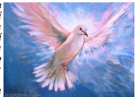
White Spirit Dove In Flight

«Այս բաները խօսեցայ ձեզի, քանի դեռ կը մնամ ձեր քով: Բայց Մխիթարիչը՝ Սուրբ Հոգին, որ Հայրը պիտի որկէ իմ անունովս, անկիւ՛ պիտի սորվեցնէ ձեզի ամէնը, եւ ինչ որ ըսի ձեզի՝ պիտի յիշեցնէ ձեզի: Խաղաղութիւն կը թողում ձեզի, ի՛նչ խաղաղութիւնս կու տամ ձեզի. եւ չեմ տար ձեզի այնպէս՝ ինչպէս աշխարհը կու տայ: Ձեր սիրտը թող չկրողովի ու չերկնչի: Լսեցիք թէ ըսի ձեզի. “Ես կ’երթամ, բայց դարձեալ պիտի գամ ձեզի”։ Եթէ սիրէիք զիս, պիտի ուրախանայիք՝ որ եւ կ’երթամ Հօրը քով, որովհետեւ իմ Հայրս ինձմէ՛ մեծ է: Եւ այժմէն՝ դեռ չեղած՝ ըսի ձեզի, որպէսզի երբ ըլլայ՝ հաւատար: Այլ շատ պիտի չխօսիմ ձեզի հետ, որովհետեւ այս աշխարհի իշխանը կու գայ. բայց ո՛չ մէկ հեղինակութիւն ունի իմ վրաս: Սակայն աշխարհը թող զհտնայ թէ եւ կը սիրեմ Հայրը, եւ կ’ընեմ այնպէս՝ ինչպէս Հայրը պատուիրեց ինձի: Ուրի՛ ելէք, երթա՛նք սակէ»: