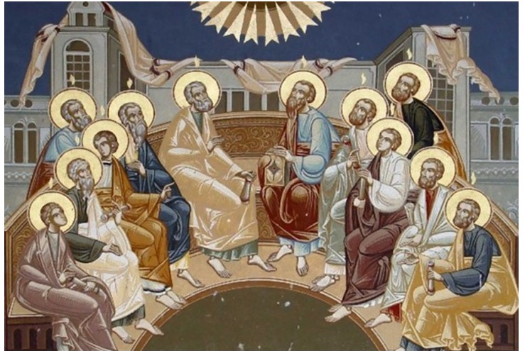
Pentecost, the Descent of the Holy Spirit

Երբ Պենտեկոստի տօնը հասաւ, բոլորն ալ միաբան՝ մէկ տեղ էին: Յանկարծ շառայ մը եղաւ երկինքէն՝ սաստկաշունչ հովի մը ձայնին պէս, ու լեցուց ամբողջ տունը՝ ուր նստած էին: Եւ բաժնուած լեզուներ երեւցան իրենց՝ որպէս թէ կրակէ, ու հանգչեցան անոնցմէ իւրաքանչիւրին վրայ: Բոլորն ալ լեցուեցան Սուրբ Հոգիով եւ սկսան խօսիլ ուրիշ լեզուներով, ինչպէս Հոգին իրենց խօսիլ կու տար: