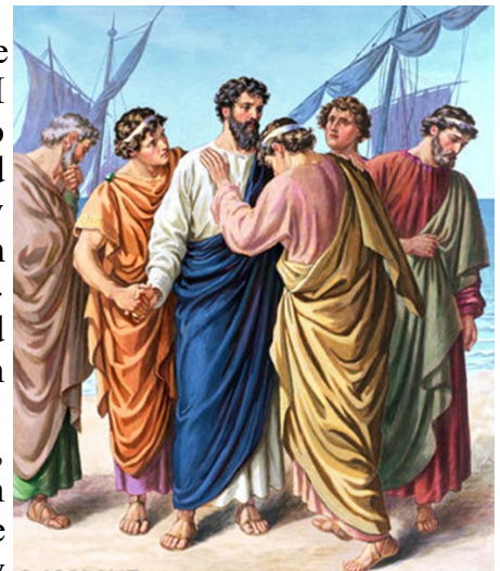
Paul's Farewell to the Elders

When Paul had finished speaking, he knelt down with all of them and prayed. They all wept as they embraced him and kissed him. What grieved them most was his statement that they would never see his face again. Then they accompanied him to the ship.