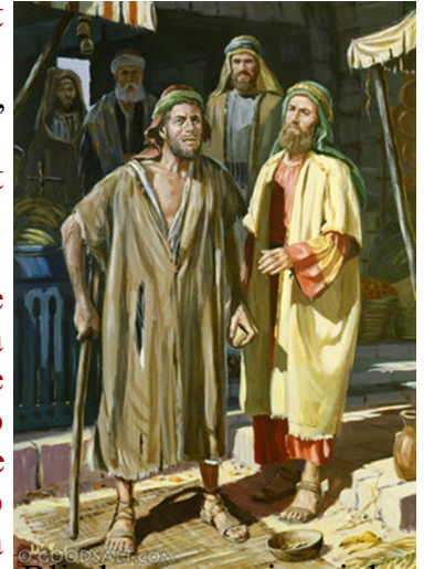
Blind man regains sight

Therefore Jesus said again, “Very truly I tell you, I am the gate for the sheep. All who have come before me are thieves and robbers, but the sheep have not listened to them. I am the gate; whoever enters through me will be saved. They will come in and go out, and find pasture. The thief comes only to steal and kill and destroy; I have come that they may have life, and have it to the full.