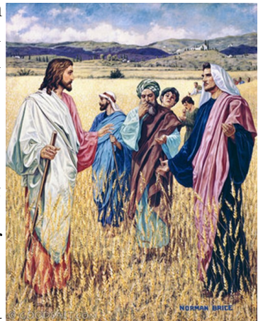
Jesus with disciples

Այդ ատեն Յիսուս՝ Շաբաթ օր մը՝ գնաց արտերու մէջէն. իր աշակերտները՝ անօթենալով՝ սկսան ցորենի հասկեր փրցնել եւ ուտել: Երբ Փարիսեցիները տեսան՝ ըսին անոր. «Ահա՛ քու աշակերտներդ կը գործեն, մինչդեռ արտօնուած չէ գործել Շաբաթ օրը»: Ան ալ ըսաւ անոնց. «Չէ՞ք կարդացեր Դաւիթի ըրածը, երբ ինք եւ իրեն հետ եղողները անօթեցան. մտաւ Աստուծոյ տունը, ու կերաւ առաջադրութեան հացերը, որ ո՛չ իրեն արտօնուած էր ուտել, ո՛չ ալ իրեն հետ եղողներուն, բայց միայն քահանաներուն: Կամ թէ Օրէնքին մէջ չէ՞ք կարդացեր թէ քահանաները կը սրբապղծեն Շաբաթը տաճարին մէջ՝ Շաբաթ օրերը, եւ անպարտ են: Բայց կը յայտարարեմ ձեզի թէ այստեղ տաճարէ՛ն աւելի մեծ մէկը կայ: Եթէ գիտնայիք թէ ի՛նչ ըսել է. “Կարեկցութիւն կ’ուզեմ, ու ո՛չ թէ զոհ”, այն ատեն չէիք դատապարտեր անպարտները. որովհետեւ մարդու Որդին տէրն է Շաբաթին»: