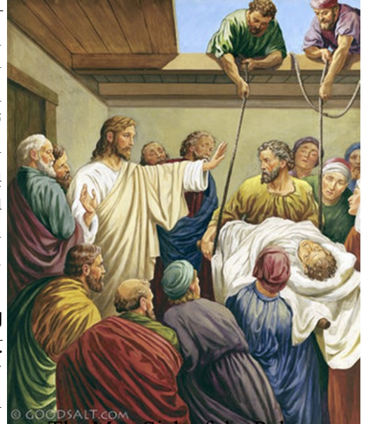
The Man Sick of the Palsy

Քանի մը դպիրներ, որ հոն նստած էին, իրենց սիրտերուն մէջ կը մտածէին. «Ինչո՞ւ այս մարդը կ'ըսէ այսպիսի հայհոյութիւններ. ո՞վ կրնայ մեղքերը ներել՝ բացի Աստուծմէ՞»: Յիսուս իսկոյն ըմբռնելով իր հոգիին մէջ՝ որ անոնք այդպէս կը մտածեն իրենք իրենց մէջ, ըսաւ անոնց. «Ինչո՞ւ այդպէս կը մտածէք ձեր սիրտերուն մէջ: Ո՞րը աւելի դիւրին է, “մեղքերդ ներուած են քեզի” ըսելը անդամալոյծին, թէ՛ “նոքի՛ ելիր, ա՛ն մահիճդ ու քալէ” ըսելը: Բայց որպէսզի գիտնաք թէ մարդու Որդին իշխանութիւն ունի երկրի վրայ մեղքերը ներելու, (ըսաւ անդամալոյծին.) “Քեզի՛ կ'ըսես. "Ուոքի՛ ելիր, ա՛ն մահիճդ ու գնա՛ տունդ"»: Ան ալ իսկոյն նոքի ելաւ, եւ առնելով իր մահիճը՝ դուրս ելաւ բոլորին առջեւէն, այնպէս որ բոլորը զմայլեցան, փառաբանեցին Աստուած ու ըսին. «Այսպիսի բան ամենեւին տեսած չէինք»: