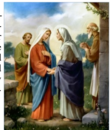
Mary Visits Elizabeth

Mary stayed with Elizabeth for about three months and then returned home.