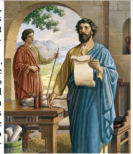
Paul Writes to Corinthians

Now this is our boast: Our conscience testifies that we have conducted ourselves in the world, and especially in our relations with you, with integrity and godly sincerity. We have done so, relying not on worldly wisdom but on God's grace.