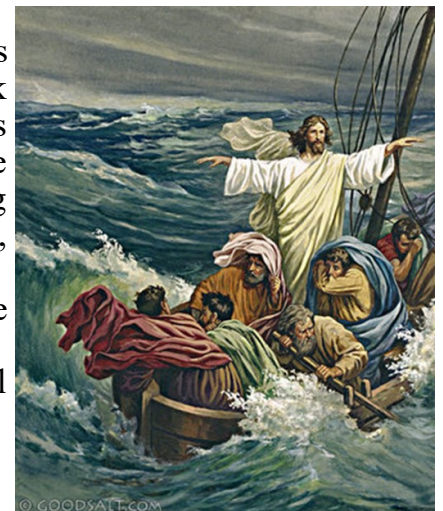
Christ Stills the Tempest

He said to his disciples, "Why are you so afraid? Do you still have no faith?"