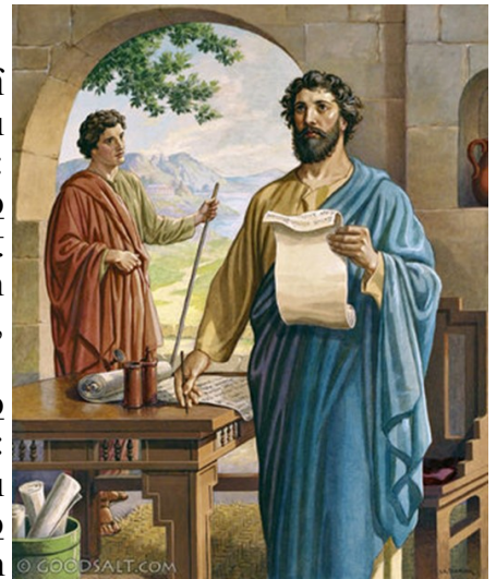
Paul Writes to Corinthians

Մեր զգացած միախառնութեան վրայ Տիտոս ատելի՛ եւս ուրախացուց մեզ, ուրախութեամբ պատմելով թէ ինչպէս բոլորդ ալ գոհ ձգած էք զինք: Չեզի համար պարծանքս յայտնած էի իրեն, եւ անօթով չմնացի. եւ ինչպէս ձեզի խօսածներս բոլորը ճշմարիտ էին, նոյնպէս ալ Տիտոսի յայտնած պարծանքս ճշմարտուեցաւ: Գիտէ՞ք թէ որքան մեծ սիրով Տիտոս կը խօսէր ձեր մասին. կը յիշէր՝ թէ ինչպիսի՛ երկիւղած յարգանքով ընդունէր էք զինք: Արդ, ուրախ եմ որ կատարեալ վստահութիւն ունիմ ձեր վրայ: